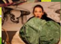
Un jardin de toutes les couleurs