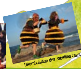
Déambulation des zabeilles zazous