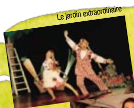
Le jardin extraordinaire

* Les sorties et spectacles sont à réserver obligatoirement au 01 34 48 66 00 ou via Facebook (places limitées).